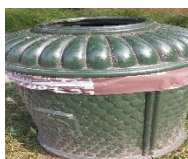
B Na 2 dagen zuivere Abri.