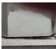
B PC gevelpaneel reinigen.