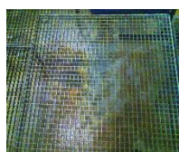
A Graffiti op een gelakte ondergrond.

Onze adviseur synchroniseert het geschikte product in een Technisch Advies naar uw (specifieker) gebruik of project/aanbestedingsonderdeel.